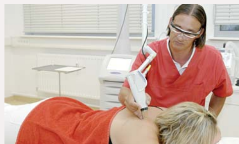
In der ALDERMA Praxisklinik werden neben Lasertherapie und ästhetischen Behandlungen auch Hautkrankheiten wie Hautkrebs behandelt und operiert.